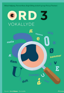
Ord 3 Vokallyde