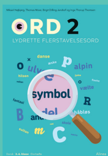
Ord 2 Lydrette flerstavelsesord