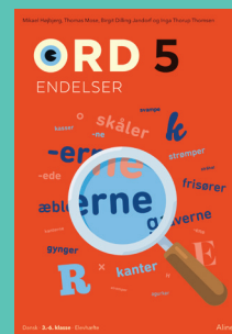
Ord 5 Endelser