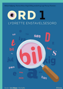
Ord 1 Lydrette enstavelsesord